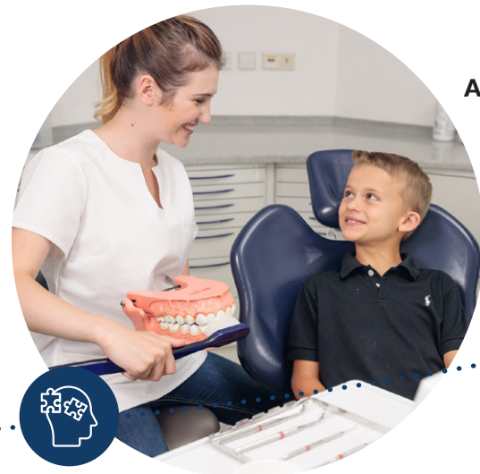
Sens psychologique dans le contact avec les patients