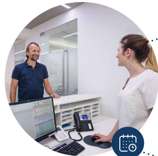
Planification des rendez-vous et des procédures internes