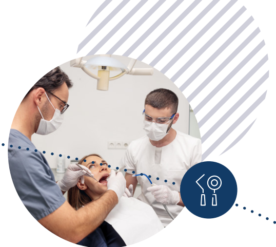
Assistance lors des examens et des traitements