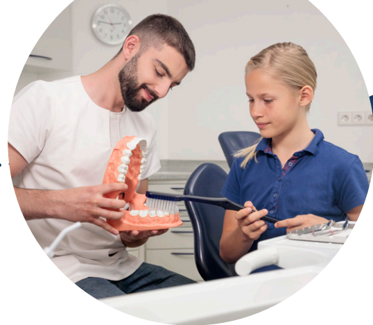
Communication et prise en charge des patients avant, pendant et après le traitement